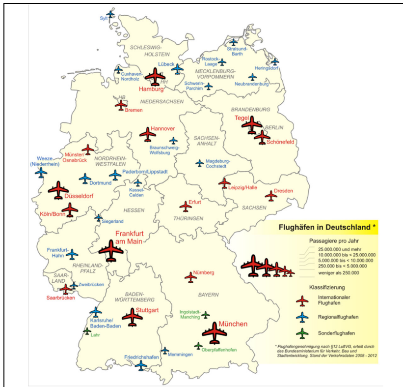
Abbildung 1: Flughäfen in Deutschland - Auswahl 4